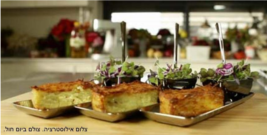
צלום אילוסטרציה. צולם ביום חול.